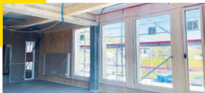
Neubau 6-fach Kindergarten Boge.

ten kürzlich die Unterlagsböden fertiggestellt werden. Anschliessend folgt der Innenausbau, die Fassaden- und dann die Umgebungsarbeiten. Dem Start im August im neuen Kindergarten steht zurzeit nichts im Wege.