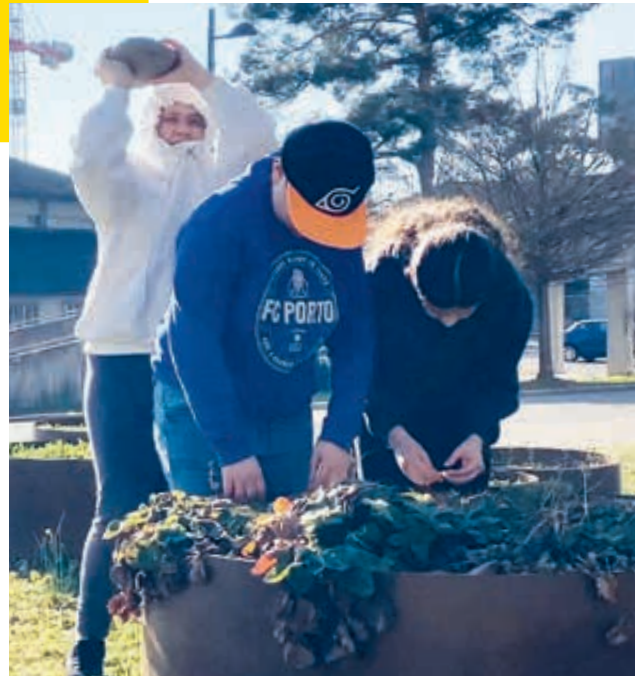
Spannung pur! Ausschnitt aus einem Kurzfilm, inspiriert von Alfred Hitchcocks Überlegungen, wie Spannung im Film entsteht.

Zudem stärkt das Filmprojekt die Bildkompetenz: Wer selbst Filme gedreht hat, versteht die Macht von Bewegtbildern und erkennt, dass Filme Realität nicht abbilden, sondern eigene Realitäten erschaffen. Dies ist ein zentrales Ziel des Fachbereichs Medien und Informatik, in dem Kinder lernen, Medieninhalte zu entschlüsseln, zu reflektieren und bewusst zu nut-