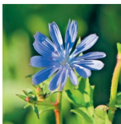
Gemeine Wegwarte Juli bis September