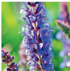
Salbei Mai bis September