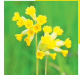
Schlüsselblümchen März bis April