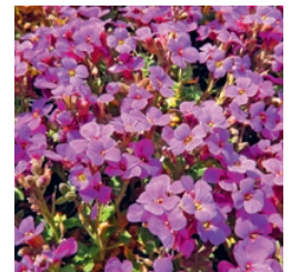
Blaukissen März bis Mai