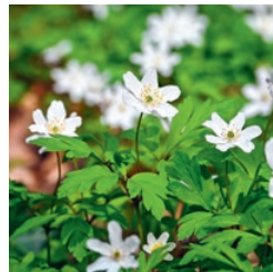
Busch-Windröschen März bis April