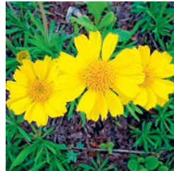
Adonisröschen Februar bis April