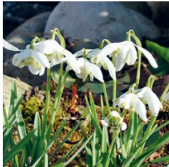
Schneeglöckchen Februar bis März