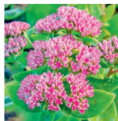
Fetthenne August bis Oktober