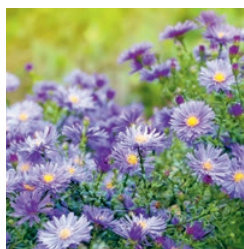
Bergastern Juli bis September