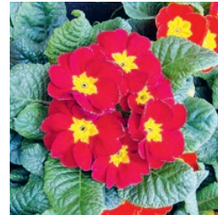
Primel Februar bis Mai