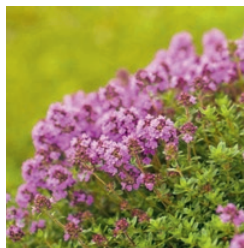
Thymian Juni bis Oktober