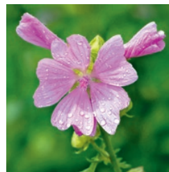
Moschus-Malve Juni bis September