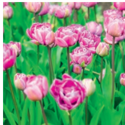
Tulpen März bis Mai