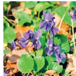
Duftveilchen März bis April