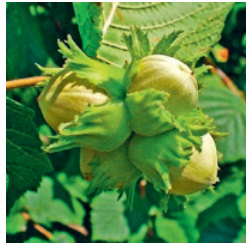
Gemeine Hasel Februar bis März