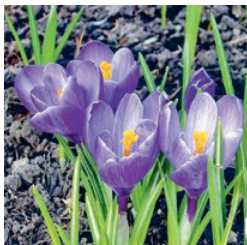
Krokusse März bis April