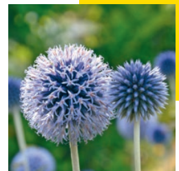
Kugeldistel Juli bis September